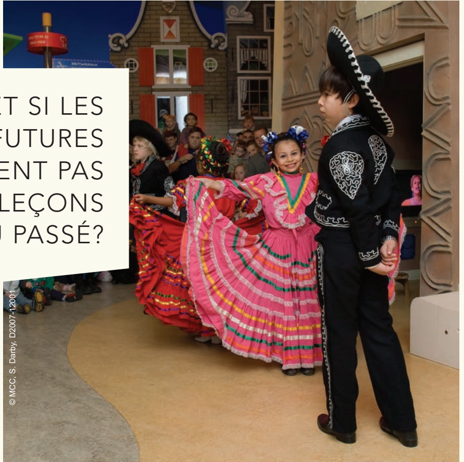
Des enfants dansant pendant le festival du Mexique au Musée des enfants