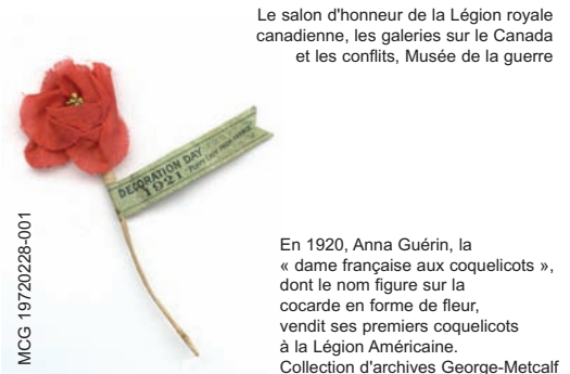
Le salon d'honneur de la Légion royale canadienne, les galeries sur le Canada et les conflits, Musée de la guerre

En 1920, Anna Guérin, la « dame française aux coquelicots », dont le nom figure sur la cocarde en forme de fleur, vendit ses premiers coquelicots à la Légion Américaine.