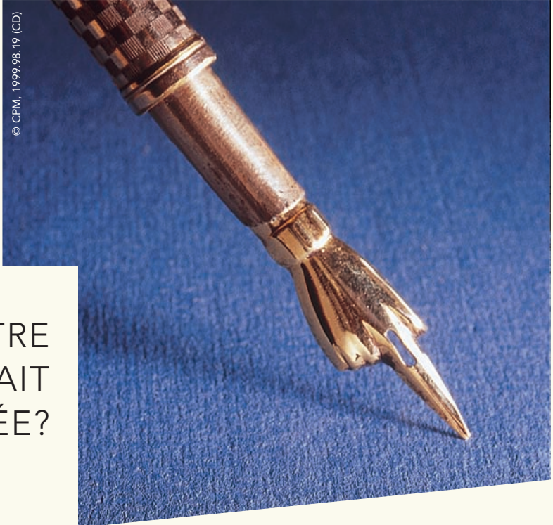
Modèle peu courant d'un porte-plume datant du XIX e siècle et portant l'inscription Fairchild 7