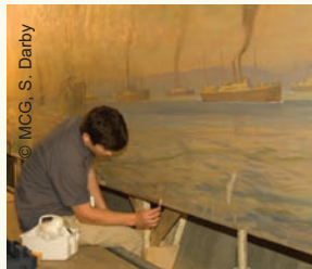
Conservation de la peinture de Frederick Challenger intitulée La grande armada du Canada, 1914, commandée par Lord Beaverbrook dans le cadre du programme d'art militaire de la Première Guerre mondiale