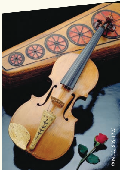
Violon et étui à violon 1978 Nelphas Prévost, 1904