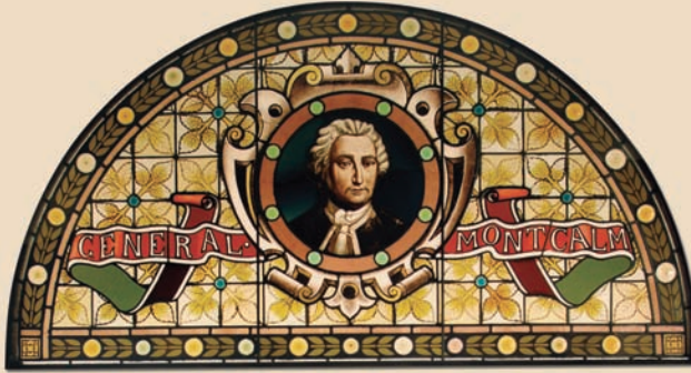
Vitraux représentant Louis-Joseph de Montcalm et James Wolfe